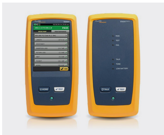
Leitungstester ETHERtest V5.1