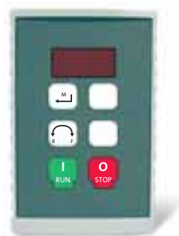
zewnętrzny moduł obsługi